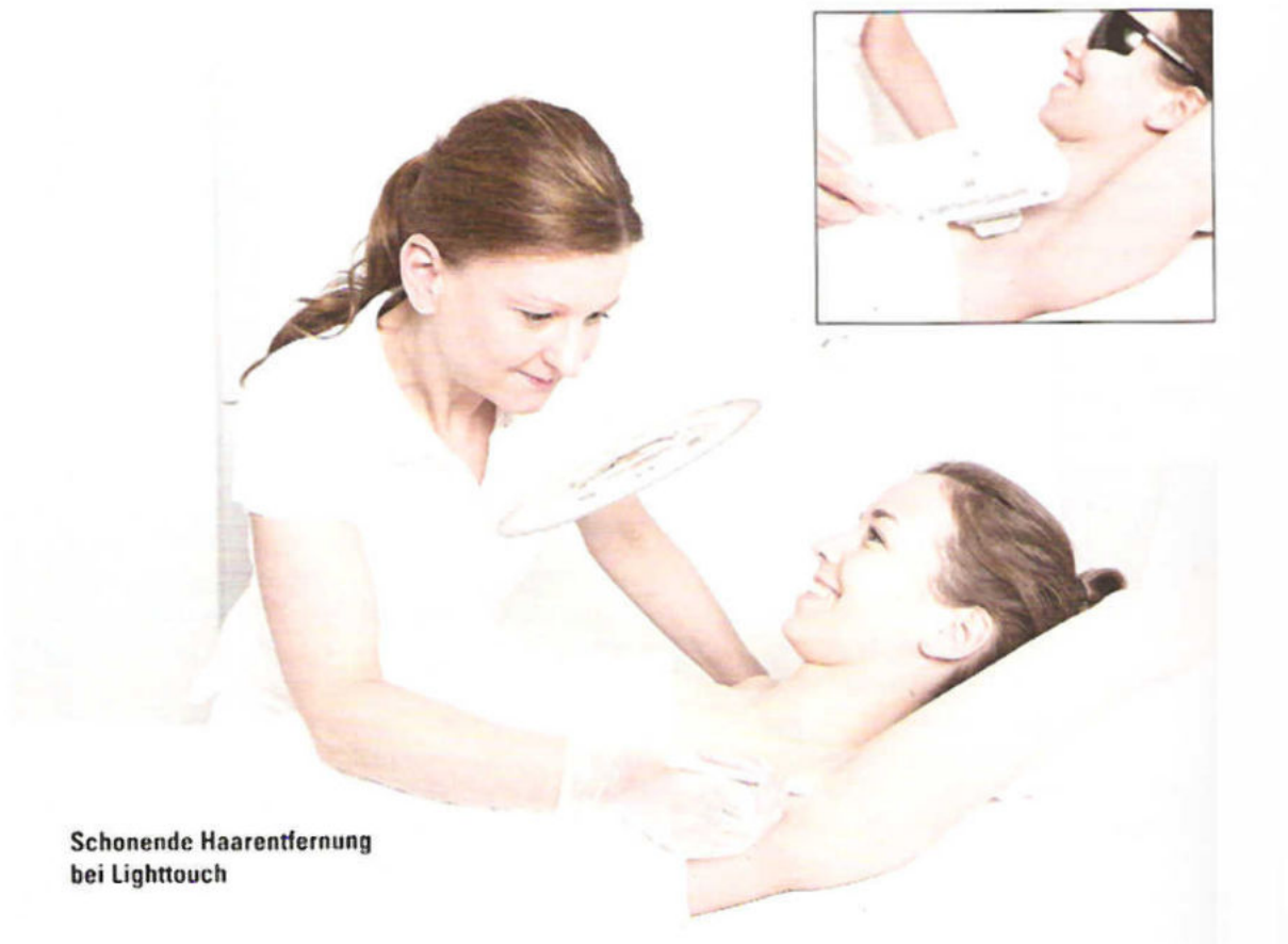
Schonende Haarentfernung bei Lighttouch

123haarfrei , Niederwallstrasse 34 (Mitte) 99 00 56 32, 123haarfrei-berlin.de